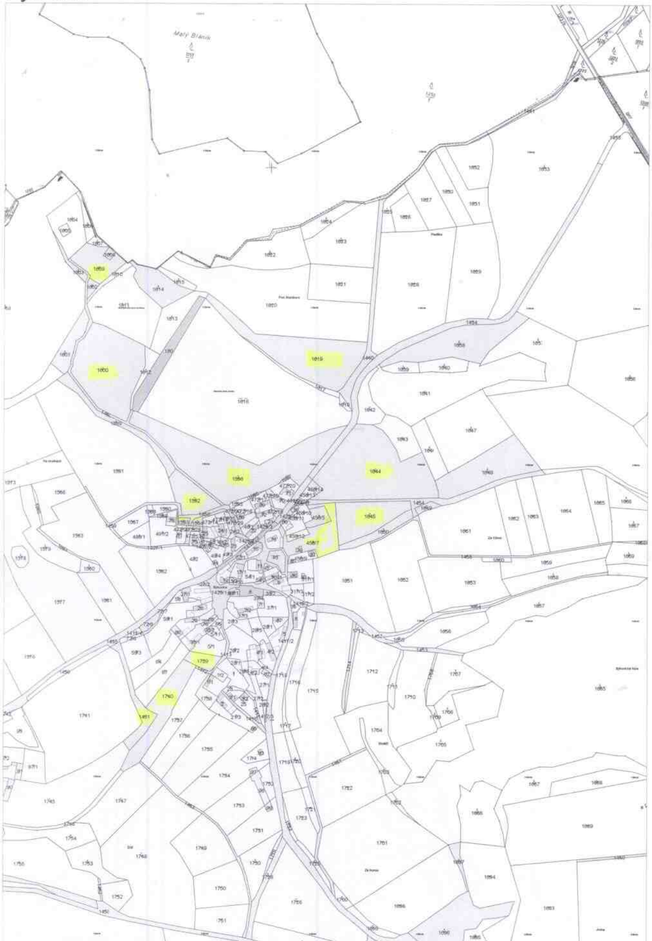
Mapa v měřítku 1:6679