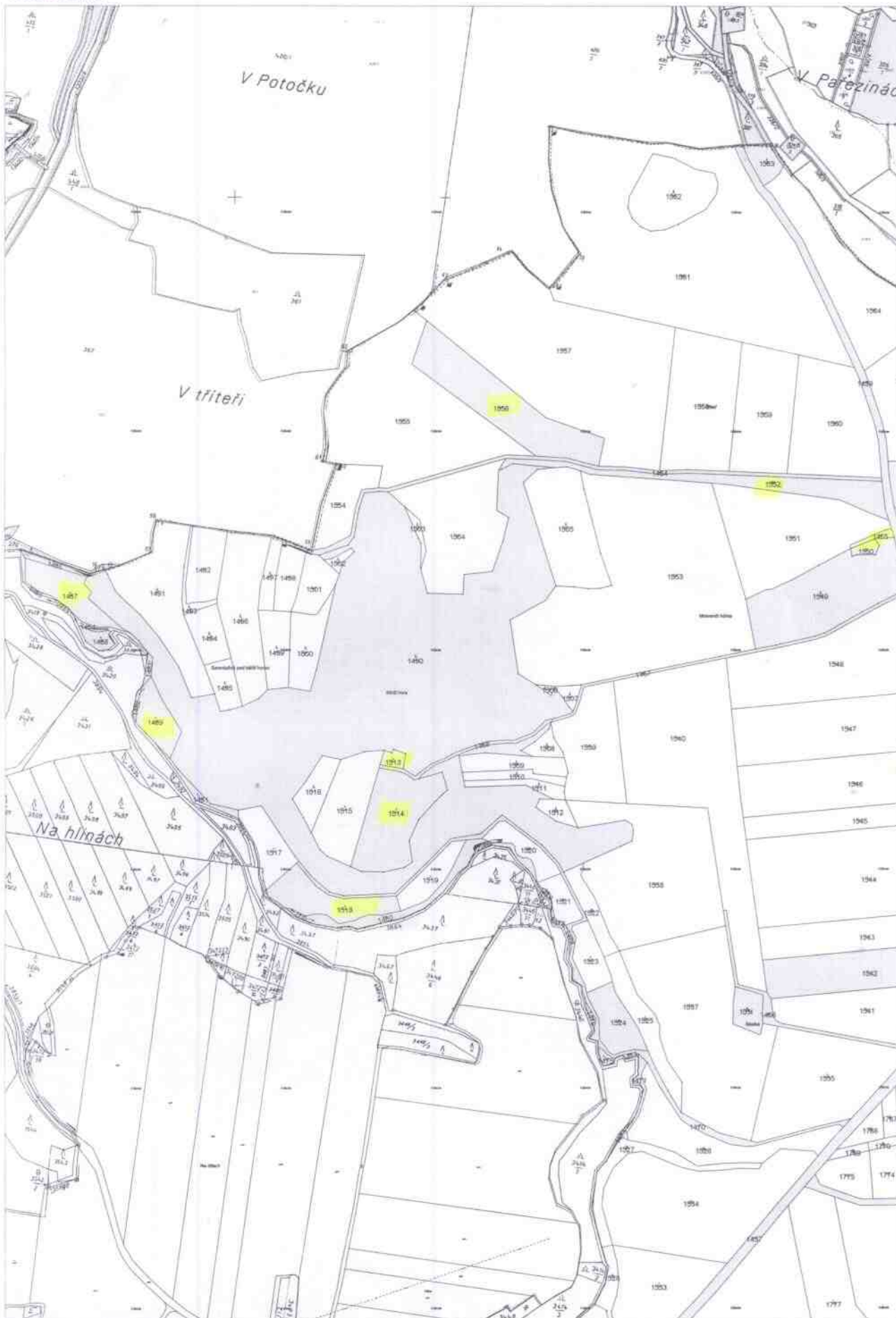
Mapa v měřítku 1:6679