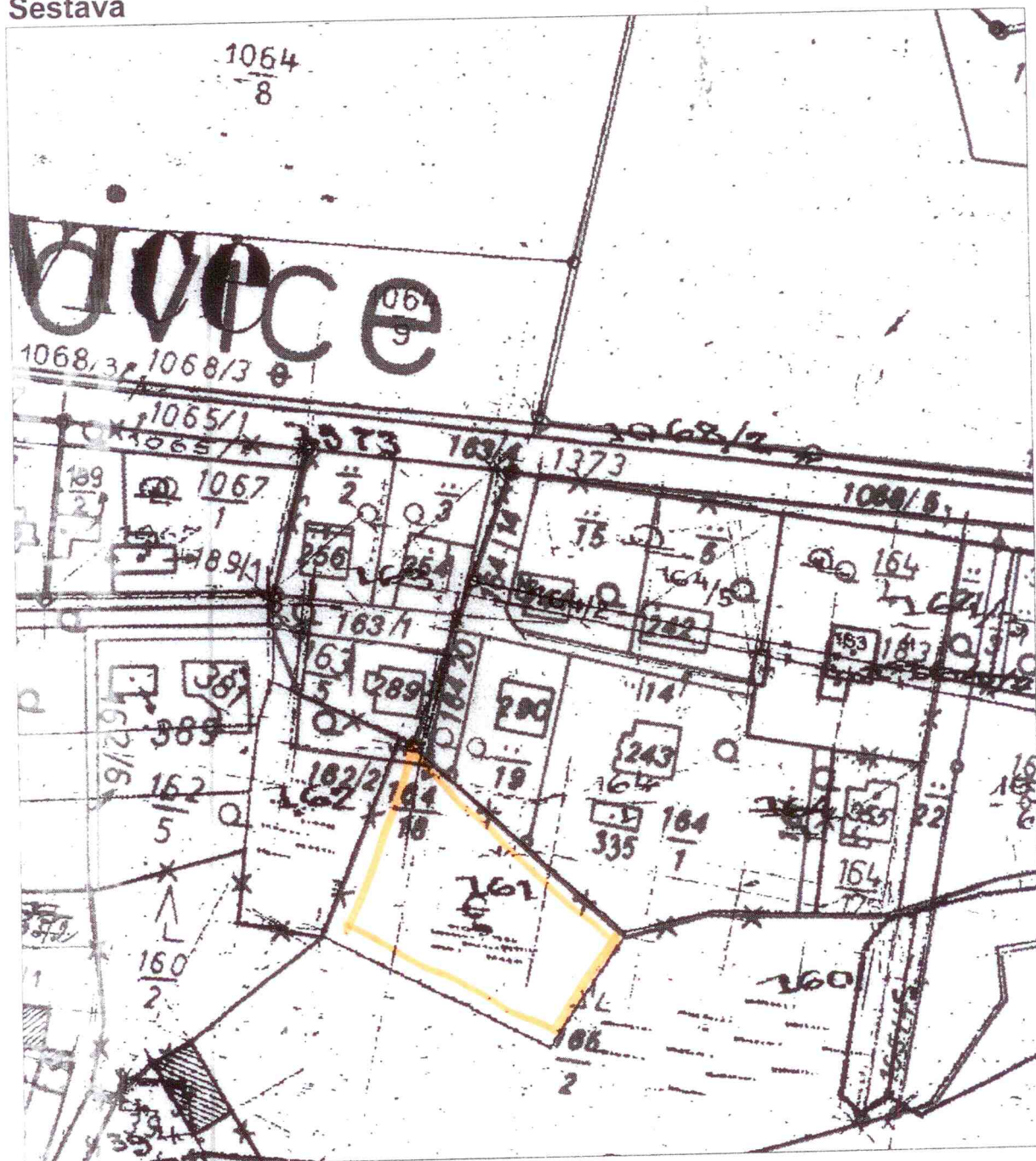
Mapa v měřítku 1:1436