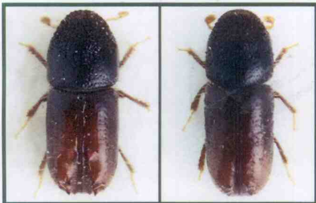
Vlevo sameček, vpravo samička lýkožrouta lesklého (zvětšeno 25x)

Nejčastěji jej nalézáme na smrku ztepilém, ale napadá i některé další druhy smrku (u nás např. smrk pichlavý), dále modřín opadavý, borovici lesní a další borovice – vejmutovka, blatka, kleč, borovice černá.