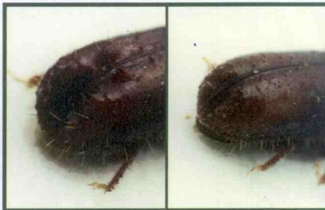
Vlevo zadní část krovek samečka, vpravo samičky lýkožrouta lesklého

Mezi nejvýznamnější predátory lýkožrouta lesklého patří brouk z čeledi Temnochilidae, kornatec dlouhý ( Nemozoma elongatum Latr.). Tento brouk je úzký, válcovitý, takže může snadno prolézat chodbami l. lesklého, kde se živí jeho larvami. V poměrně vysokém počtu bývá nalézán v odchycích l. lesklého v lapačích, kde jeho podíl může činit až 4 % odchytů l. lesklého. Další predátory z řádu brouků, i když již méně významní, jsou z čeledi stěvlíkovitých (Carabidae), drabčíkovitých (Staphilinidae), mršňkovitých (Histeridae), potemnkovitých (Tenebrionidae), pestrokrovečnickovitých (Cleridae), lesknáčkovitých (Nitidulidae) a jim příbuzné čeledi Rhizophagidae.