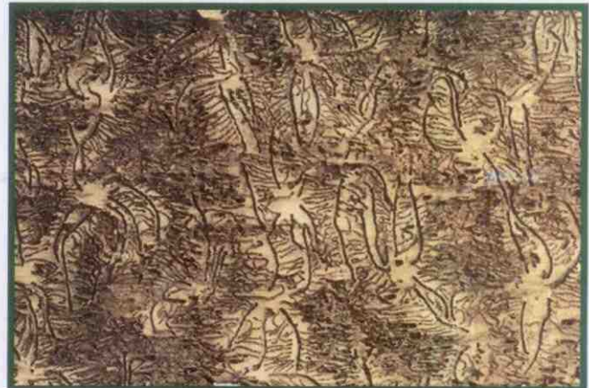
Požerky lýkožrouta lesklého

K odchytným lýkožrouta lesklého jsou vhodné nárazové typy lapačů (štěberinové lapače typu Theysohn nebo křížové lapače typu Ecotrap). Sítko ve sběrných kontejnerech musí být dostatečně husté, aby nedocházelo