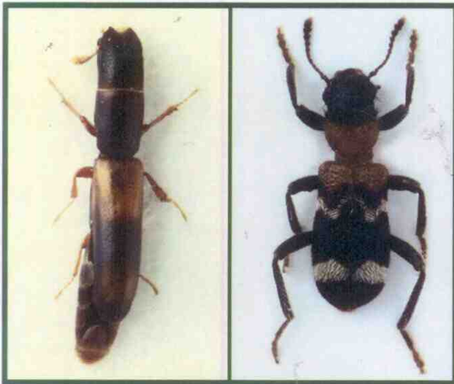
Predátoři lýkožrouta lesklého: vlevo kornatec dlouhý ( Nemozoma elongantum ), zvětšeno 14x, vpravo pestrokrovečník mravenčí ( Thanosinus formicarius ), zvětšeno 9x

Významné jsou i některé druhy dvoukřídých (např. z rodu Medetera ) a blanokřídých (např. chalcidka Psychophagus abieticola Ratz. nebo lumčici rodu Spathius , Ecphylus a Cosmophorus ), jejichž larvy parazitují na vajíčkách, případně larvách I. lesklého. Na dospělých parazitují roztoči (např. Uropoda polysticta Vitzth.) nebo cizopasně hlístice (např. zástupci rodů Panagrolaimus nebo Parasitophelenchus ).